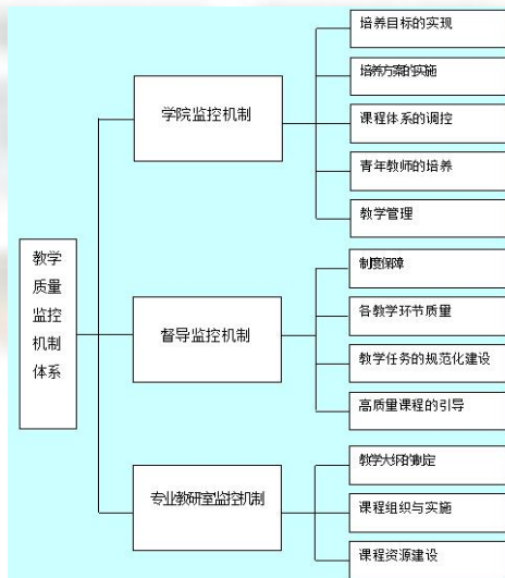
图1 专业质量保障体系架构图

商务英语专业制定了系列文件,使各项教学管理工作日趋规范化,在制度上为教学质量的稳步提高提供保障;构建商务英语专业教学质量监控机制,主要由学术委员会制度、教学管理人员听查课制度、教学督导制度、教师互听课制度、学生评教制度、教材评价制度和监控资料的文档管理制度等七个部分组成;从监控层面来看,专业全方位、全过程的教学质量监控机制涉及领导班子、教学督导组 and 教研室三个层面。