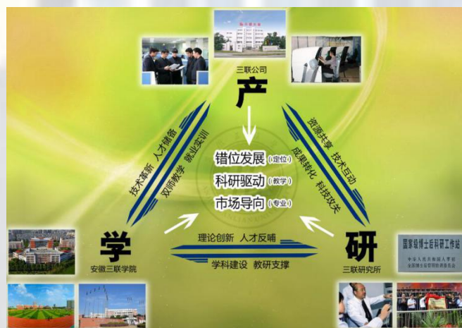
图3 安徽三联学院交通运输专业“自体式”产学研构成

高校应积极与企业、科研机构合作, 充分发挥自我科研优势, 在企业和高校之间形成共赢模式, 不断推进人才培养、人文交流、技术研发等。这种校企之间的产学研模式是我国大部分高校常见的模式, 可以较好地实现学术成果转化、提高服务地方经济水平等。安徽三联学院自建校伊始, 就有着得天独厚的产学研建设的土壤, 安徽三联交通事故预防研究所、安徽三联交通应用技术股份有限公司、国家车辆驾驶安全工程技术研究中心、人类工效学杂志社等研究机构、企业和学术杂志社构成了安徽三联学院“自体式”产学研的独特模式, 这种产学研模式不仅实现了原有的功能, 而且实现了科研资源共享、人员双轨制服务的新型模式。